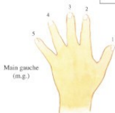
Main gauche (m.g.)