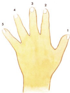
Main gauche (m.g.)